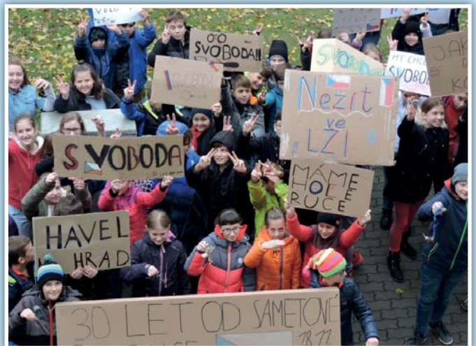
Projekt kvýročí Sametové revoluce