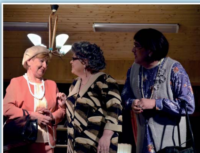
Tři dámy o pistolí, demitéra