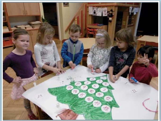
Mateřská škola Sluníčko