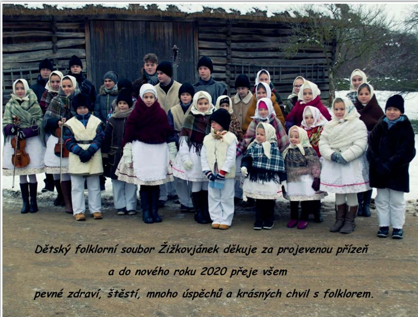
Dětský folklorní soubor Žižkovjánek děkuje za projevovou přízeň a do nového roku 2020 přeje všem pevné zdraví, štěstí, mnoho úspěchů a krásných chvil s folklorem.

Mor. Žižkov 23. 11. 2019 RNDr. Milka Litschmannová