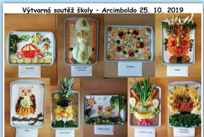
Výtvarná soutěž školy

Vydavatel: Obecní úřad Moravský Žižkov Adresa redakce: Obecní úřad v Moravském Žižkově, Za Školou 555, 691 01 Odpovědný redaktor: Mgr. Miloslav Sova Grafická úprava a tisk: Tiskárna Brázda, www.TiskarnaBrazda.cz, tel.: 518 367 450, 608 709 602 Povoleno: OÚ Břeclav pod registračním znakem MK ČR E 11626