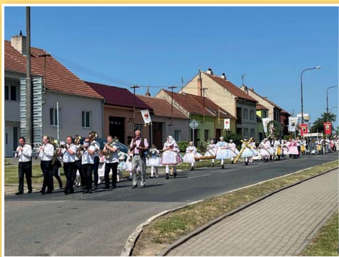
Slavnost Nejsvětějšího Srdce Ježíšova