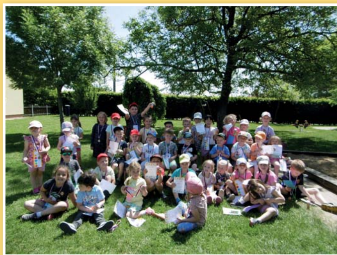
Mateřská škola Sluníčko