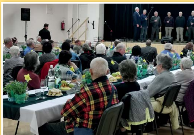
Beseda s důchodci