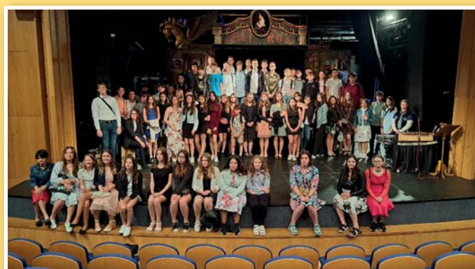
Základní škola v Divadle Radost

Vydavatel: Obecní úřad Moravský Žižkov Adresa redakce: Obecní úřad v Moravském Žižkově, Za Školou 555, 691 01 Odpovědný redaktor: Mgr. Miloslav Sova Grafická úprava a tisk: Tiskárna Brázda, www.TiskarnaBrazda.cz , tel.: 518 367 450, 608 709 602 Povoleno: OÚ Břeclav pod registračním znakem MK ČR E 11626