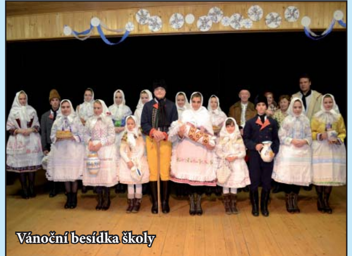
Vánoční besídka školy