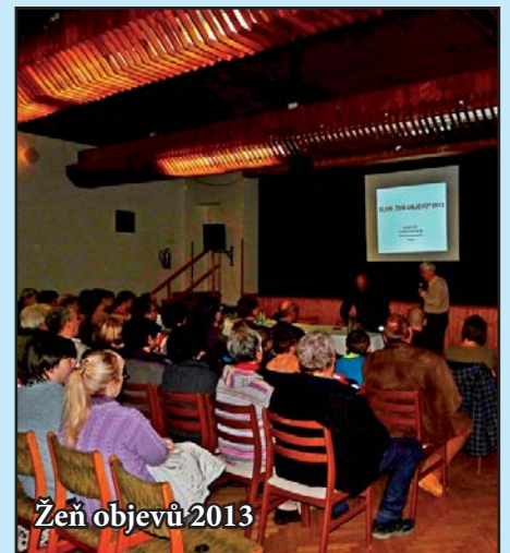
Žeň objevů 2013

Vydavatel: Obecní úřad Moravský Žižkov Adresa redakce: Obecní úřad v Moravském Žižkově, Bílovska ulice, 691 01 Odpovědný redaktor: Mgr. Miloslav Sova Grafická úprava a tisk: Vydavatelství Brázda Břeclav, tel.: 518 367 450, 608 709 602 Povoleno: OÚ Břeclav pod registračním znakem MK ČR E 11626