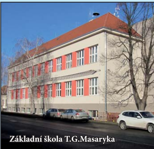
Základní škola T.G.Masaryka