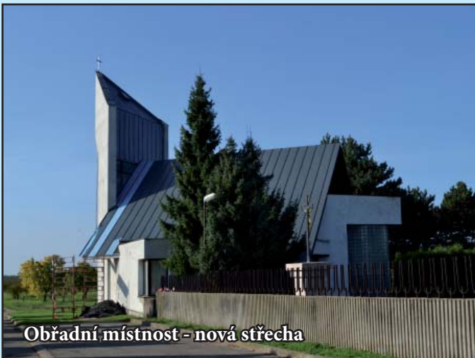
Obřadní místnost - nová střecha