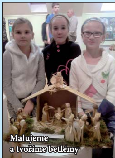
Malujeme a tvoříme betlémy