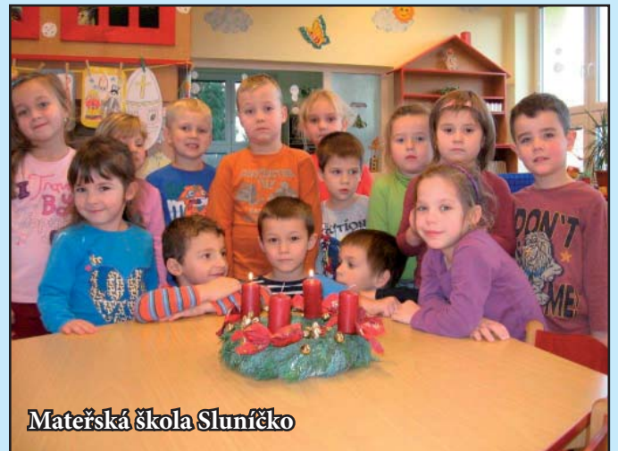
Mateřská škola Sluníčko